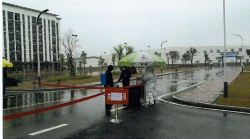
图 12 疫情期间防疫

公司始终坚持“实干兴业，实业报国”的核心价值观，致力于中国牛仔服装原料的研发生产，恪守“诚信是金，厚德永盛”的经营理念，脚踏实地，做强企业。“奋进正当时，创新天地宽”，湖北德永盛纺织有限公司诚迎海内外朋友共商共谋，共进共荣，共同发展！