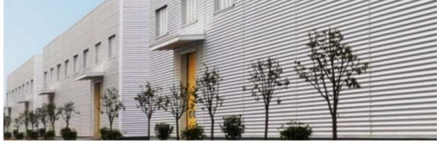
图 2 仓库外景照片

厂区遵循“绿色、环保、节能、安全”的设计理念，实现从原料到筒纱的智能化生产流程，从工厂环境辅助设备的监控到设备运转数据的采集，从设备单元的自动化、智能化到工厂生产自动化、连续化、网络化、智能化，最终实现无人化管控。可实现企业从设计、工艺、制造到物流等环节的集成优化、生产全流程数字化监控和大数据智能分析决策，提升生产效率和产品质量。依托航数信息系统云服务平台实现对棉纺织设备数据的自动采集，正确及时集成棉纺织主辅机设备的生产数据、在线和离线的质量、纺织工艺、车间环境、设备能耗数据和人员数据等，搭建企业的数据平台，实现 ERP 系统与生产过程控制系统的数据共享和功能集成，构建企业管控一体化平台。