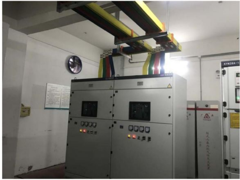
图 10 光伏发电项目