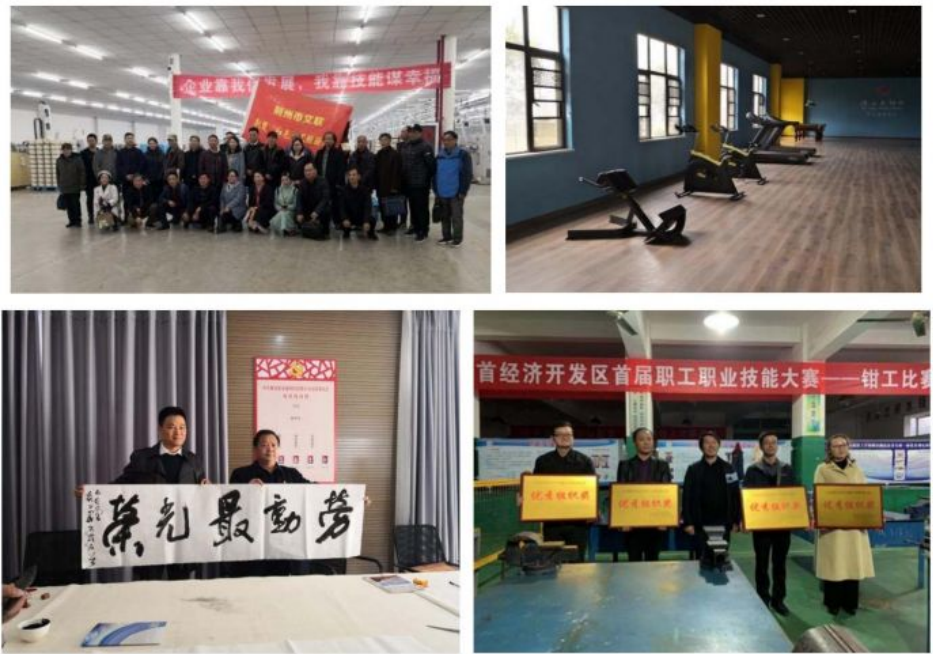
图 8 德永盛员工关怀

2019 年德永盛纺织有限公司举办了“中国梦、劳动美”劳动竞赛活动，2021 年元旦，集团以“团结友爱”为主题在企业内部开展了冬季趣味运动会，旨在弘扬健康生活理念，打造文明和谐、幸福有爱的工作环境。