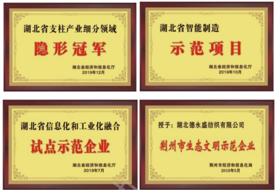
图 6 企业近年荣誉墙