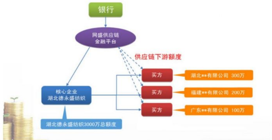
图 9 德永盛“供应链”

德永盛金宝拥有 3000 万供应链核心额度，该额度将切分给合格下游用于采购湖北德永盛纺织的产品。