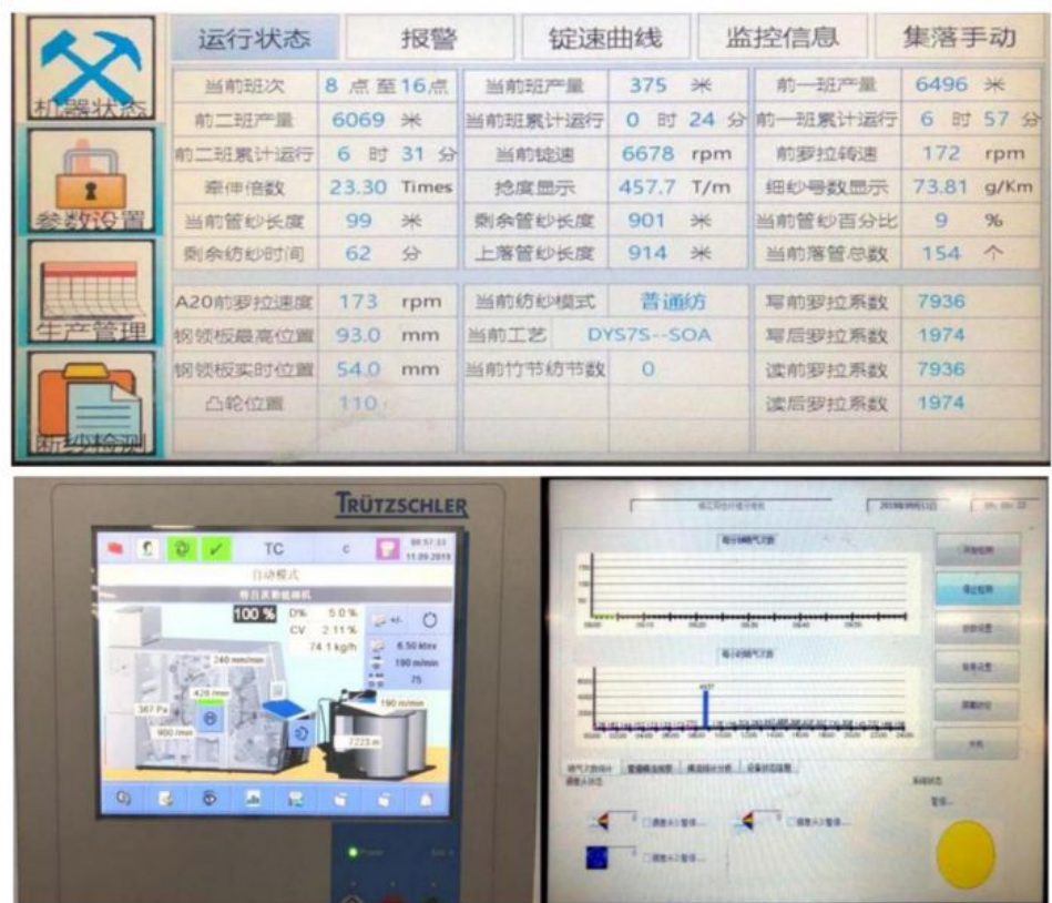
图 3 数据系统集成

公司始终秉承“创新、绿色、智能、卓越”的发展理念，与武汉纺织大学开展科研合作，共建“中国牛仔服装工程技术重点实验室纱线开发基地”和“中国先进纺纱织造及清洁生产国家产学研基地”。公司科技创新成果显著，硕果累累。先后获得“湖北省支柱产业细分领域隐形冠军”、“湖北省智能制造示范项目”、“湖北省工业化和信息化两化融合示范企业”等荣誉。至 2019 年底，公司共获专利 17 项。