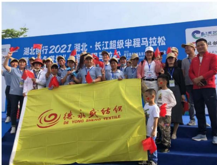
图 11 赞助长江超级半程马拉松

2021 年 5 月 5 日，湖北银行 2021 湖北·长江超级半程马拉松暨“德永盛杯”石首半程马拉松上午 7 点半在陈家湖广场准时鸣枪开跑。漫长的马拉松赛道上，除了那些奋力向前的奔跑者、赛场边呐喊欢呼的观众们，志愿者们默默奉献的身影更是一道靓丽的风景线。最终赛事圆满落幕，800 名志愿者协同“德永盛”以自己的实际行动，传递出了热心奉献的公益精神，同时，也将代表着石首江豚微笑天使的热情笑容，留在了每一位参赛者心中。